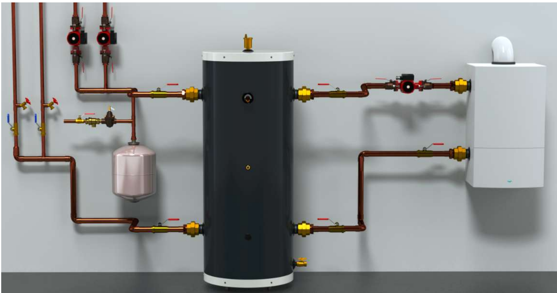
Figure 1: Installation typique du BUFFMAX