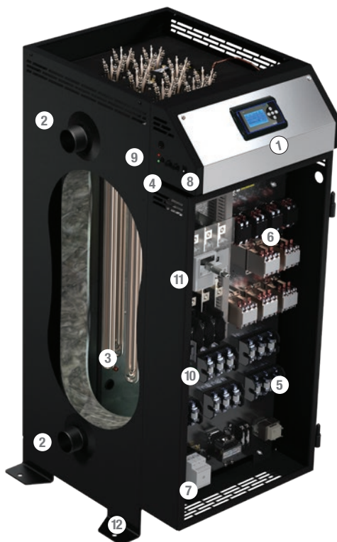
VoltMax SCR 180 KW – 600 V avec option sectionneur de courant